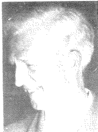
אישים שטיפלו ב"דליפות" בשנותיה הראשונות של המדינה. למעלה: דוד בן גוריון ומשה שרת; למטה: גיימס מקדונלד ויגאל ידן.

הפרסום האומלל הזה. מה שאינו מוטל בספק הוא, כי הדבר הנחיל לנו בושט פנים מאין כמוה וערער במדה חמורה מאד את אמון נציגי ארצות הברית ביכולתנו לשמור סוד.